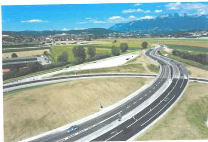
Aménagement et doublement RD 3508 EPAGNY METZ-TESSY ANNECY

La zone commerciale Grand Epagny est la plus grande et la plus attractive du bassin Annécien avec près de 250 enseignes, 5000 places de parking et 5 M de visiteurs par an.